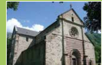
Belpátfalva (Bélaháromkút) 1232