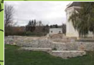
Veszprémvölgy 1240-1552 (Körmend 1552-1641)